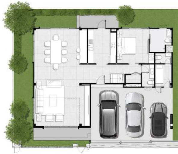
1 st floor