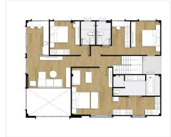
2 nd floor