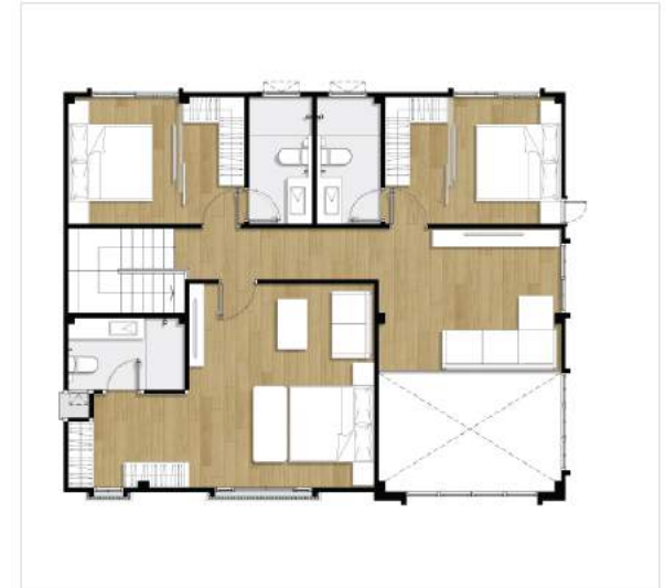
2 nd floor