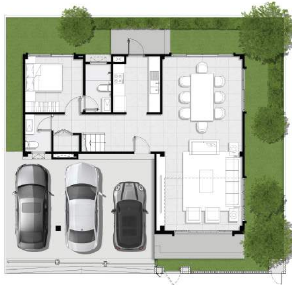
1 st floor